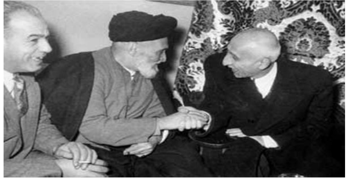
دکتر مصدق و آیت الله کاشانی