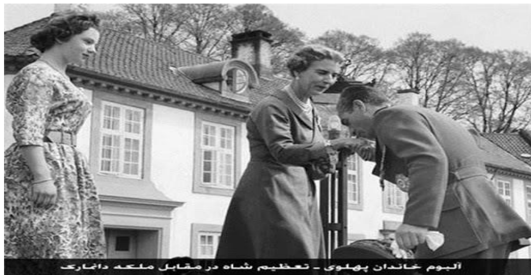
آلبوم خاندان پهلوی - تعظیم شاه در مقابل ملکه دانمارک