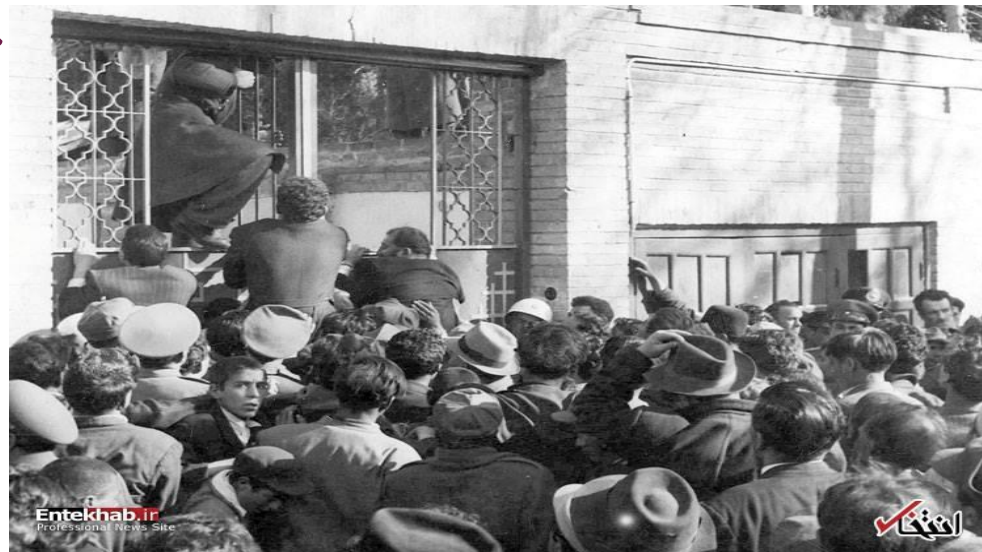
غارت هتل دکتر مصدق