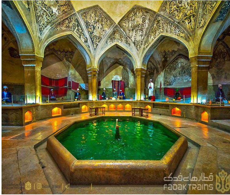
مقام و کیل