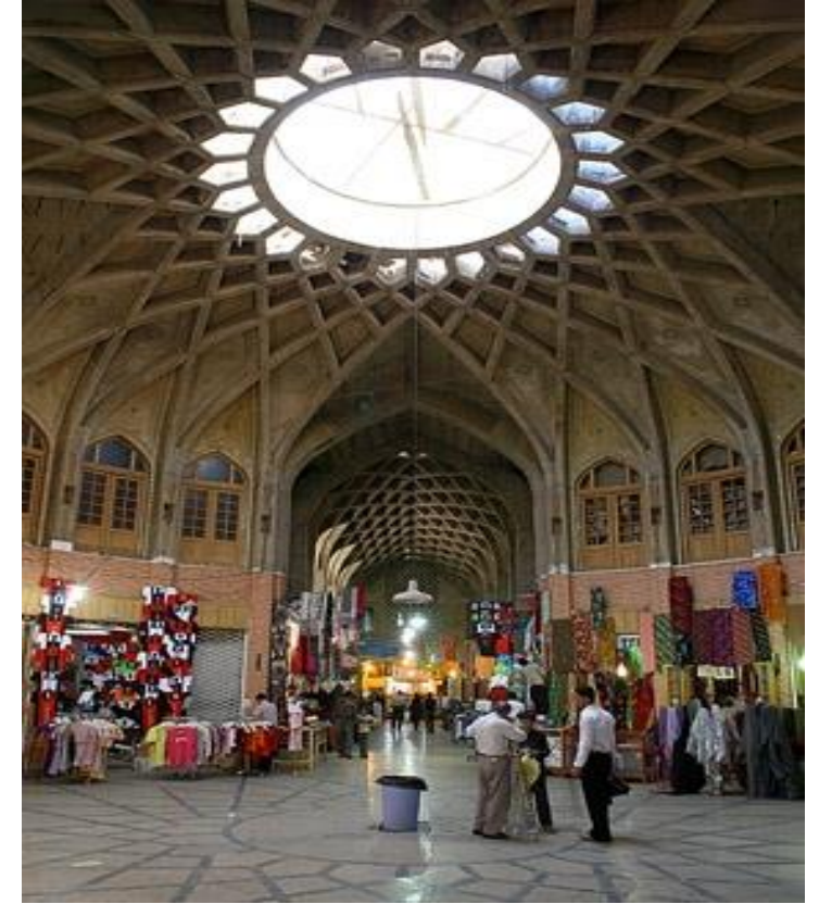
بازار و کیل