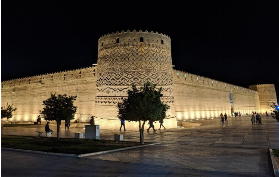
ارگ کریم خان زند