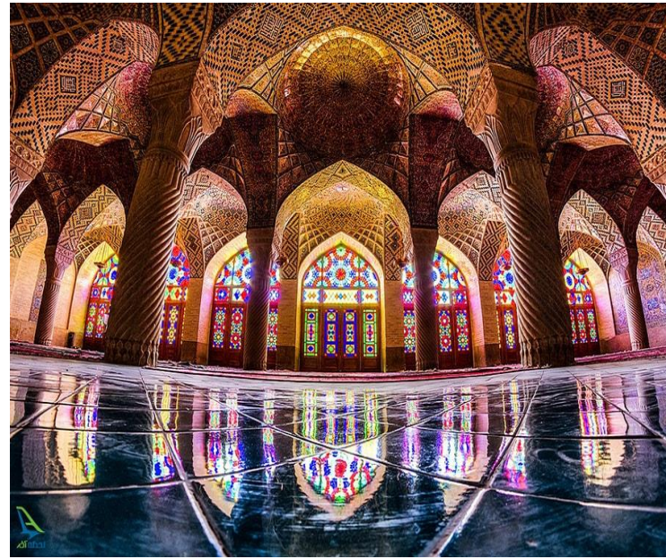
مسجد و کیل